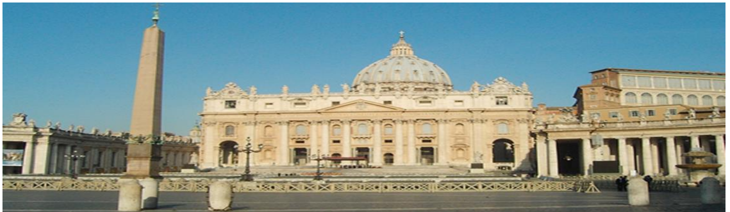
Basílica de San Pedro – Ciudad del Vaticano

Desayuno y salida en dirección a Lanciano, en la provincia de Chieti, para realizar la visita de la Iglesia de San Francisco, donde se encuentran las reliquias del “Milagro Eucarístico de Lanciano”, continuaremos nuestro viaje hacia San Giovanni Rotondo para visitar el Santuario del padre San Pío de Pietrelcina, canonizado en el año 2,002 por Su Santidad San Juan Pablo II. Después del almuerzo en un restaurante, continuaremos nuestra ruta hacia la región de Campania hasta llegar a su capital: Nápoles. Cena y alojamiento en el hotel.