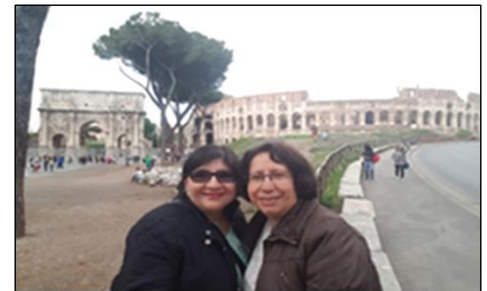
El Arco de Constantino y El Coliseo

Desayuno en el hotel. Por la mañana nos dirigiremos hacia la Ciudad del Vaticano para visitar los Museos Vaticanos con la impresionante Capilla Sixtina con frescos del maestro Miguel Angel, finalizando nuestra visita en la Basílica de San Pedro. Almuerzo en un restaurante. Por la tarde realizaremos la visita panorámica de esta bella ciudad, conocida como “La Ciudad Eterna”, durante la cual podremos contemplar la Plaza Venecia con el Monumento a Víctor Emmanuel II, los Foros Romanos, el Coliseo, etc. Cena y alojamiento.