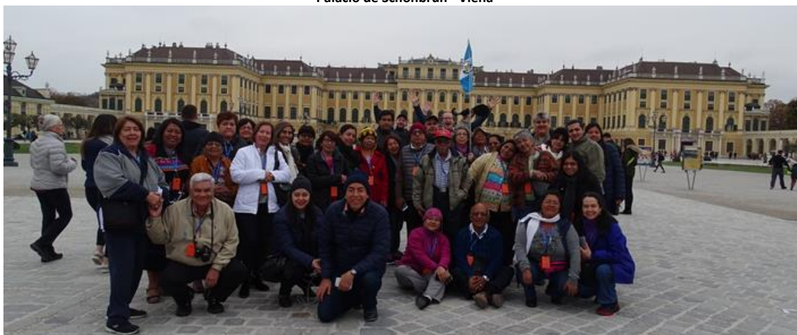
Palacio de Schönbrunn - Viena

Desayuno y día libre para pasear por la ciudad o realizar compras. Alojamiento.