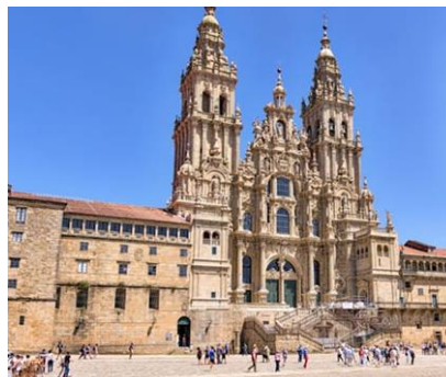
Catedral de Santiago de Compostela