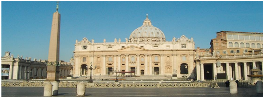
Basílica de San Pedro – Ciudad del Vaticano