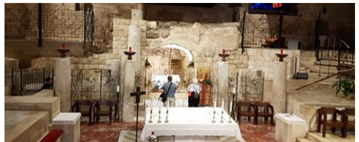
Gruta de la Anunciación – Nazaret

Desayuno y salida hacia Yafo, Jope antiguo puerto de Israel, convertido en barrio de artistas, de donde el Rey Salomón trasladó los Cedros del Líbano para construir el Templo de Jerusalén, lugar donde se encuentra la casa de El Curtidor. (He IX, 36-43; He X, 9-23. Continuación a Cesárea, antigua Capital Romana, con su Anfiteatro Romano y Fortaleza de los Cruzados (He X, 1 y siguientes) proseguiremos nuestro recorrido hacia Haifa, visita de la ciudad y subida al Monte Carmelo, viñedo de Dios, lugar del desafío del Profeta Elías, (1 Re XVIII, 17-46); visita de la Iglesia Stella Maris, sede mundial de la Cofradía de los Carmelitas y lugar de culto de Nuestra Señora del Carmen. Desde el mirador tendremos una vista panorámica de la ciudad de Haifa y su puerto. Visita del Templo Bahá'i y sus Jardines Persas, si está abierto. Almuerzo en ruta. Seguiremos nuestro viaje hacia la Galilea pasando por Caná (Jn. II, 1-12), donde se realizó el Primer milagro de Jesús, convirtiendo 600 litros de agua en vino, donde las parejas tendrán la posibilidad de renovar las promesas matrimoniales. Continuación a Nazaret donde se desarrolló la infancia y juventud de Jesús. Visita de la Iglesia de la Anunciación, lugar donde se llevaron a cabo la Anunciación y la Encarnación del Hijo de Dios. (Lc. I, 26-38) y la Carpintería de San José. Por la tarde-noche llegaremos a la ciudad de Tiberiades. Cena y alojamiento en el hotel.