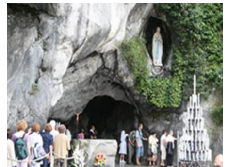
Gruta de las Apariciones - Lourdes