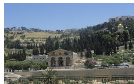
Monte de los Olivos – Jerusalén

Desayuno en el hotel. Por la mañana salida para realizar la visita al Monte de Los Olivos con la Iglesia de la Ascensión, Iglesia del Padre Nuestro, donde esta oración se encuentra escrita en más de 100 idiomas. Desde el mirador tendremos una maravillosa vista de la Mezquita de Omar o Monte Moria; donde Abraham iba a sacrificar a su hijo Isaac, lugar donde Salomón construyó el Primer Templo. Continuaremos hacia el Huerto de Getsemaní, donde hay 8 olivos, testigos del sudor de sangre de Cristo (Mt. XXVI, 36-46; Lc. XXII, 39-46). Visita de la Basílica de la Agonía o de Todas las Naciones. Después del almuerzo salida hacia Belén y realizaremos la visita de la Gruta de la Natividad, (Lc. II, 1-20). Celebración de la Santa Misa en Belén. Regreso al hotel, cena y alojamiento.