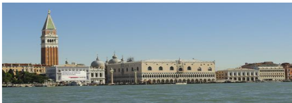
Plaza de San Marcos – Venecia