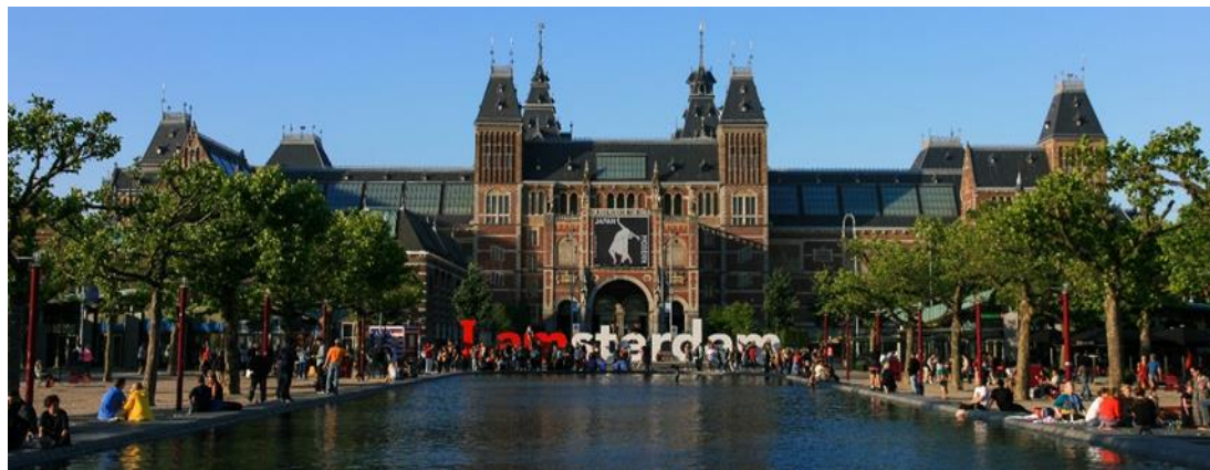
Museo Nacional Ámsterdam - Holanda