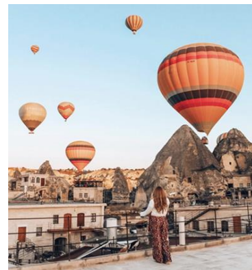
Göreme – Capadocia