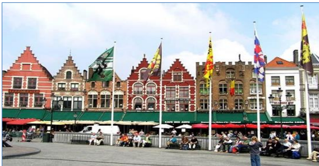
Plaza Mayor – Brujas