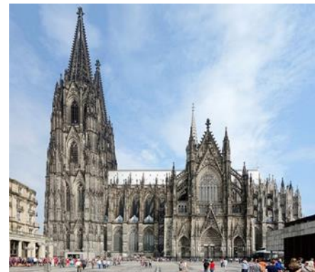
Catedral de Colonia

Desayuno y continuaremos nuestra ruta hacia Alemania, llegaremos a Colonia, donde tendremos tiempo libre para poder visitar su bella catedral, continuaremos bordeando el río Rin hasta Boppard, donde embarcaremos para realizar un crucero por el río hasta St. Goar Almuerzo y continuación a Frankfurt, donde llegaremos al centro de la ciudad y dispondremos de tiempo libre para recorrer caminando su centro histórico y la plaza de Romer, antes de dirigirnos a nuestro hotel. Cena y alojamiento en el hotel.