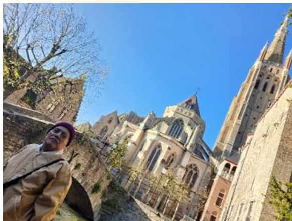
Iglesia de Nuestra Señora de Brujas y Puente Bonifacio - Brujas