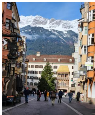
El Tejadito de Oro – Innsbruck