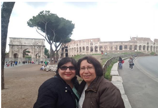
El Coliseo – Roma