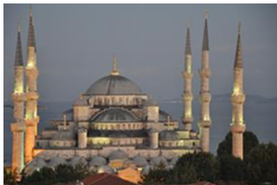
Mezquita Azul –Estambul